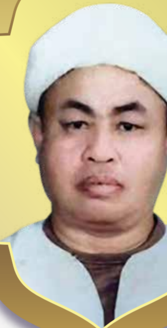
MUFTI PERTAMA KERAJAAN NEGERI, NEGERI SEMBILAN